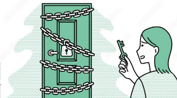
危険と分かっているにも、 つい試したくなる心理効果