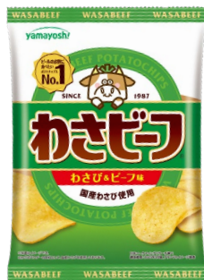
商品特徴を凝縮した わさびビーフの粉