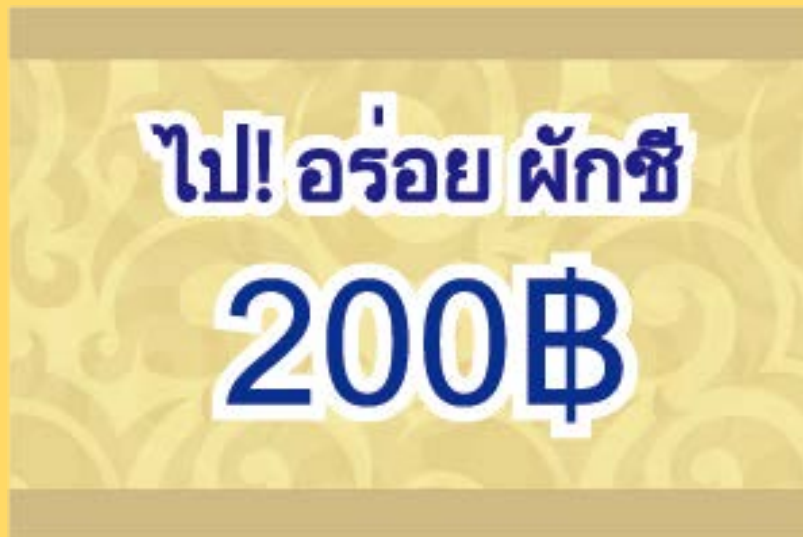
パクチーチケット イメージ

GOアプリでTAXIを呼び寄せた際に、このチケットを見せると、銀座駅周辺のタイ料理屋へランダムで移動することができる。