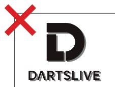
ドロップシャドウ