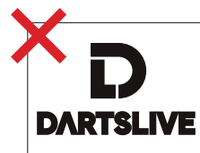
ロゴの文字部分の太さや大きさの変更