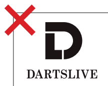
ロゴの文字部分の書体の変更