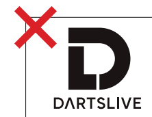
シンボルと文字バランスの変更